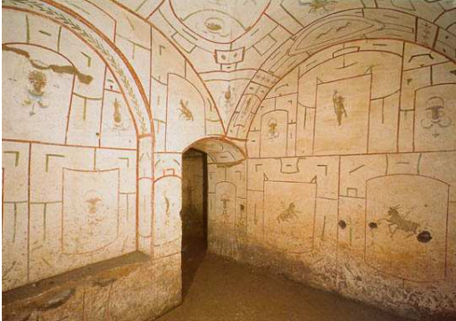
Catacombe di San Sebastiano, Roma