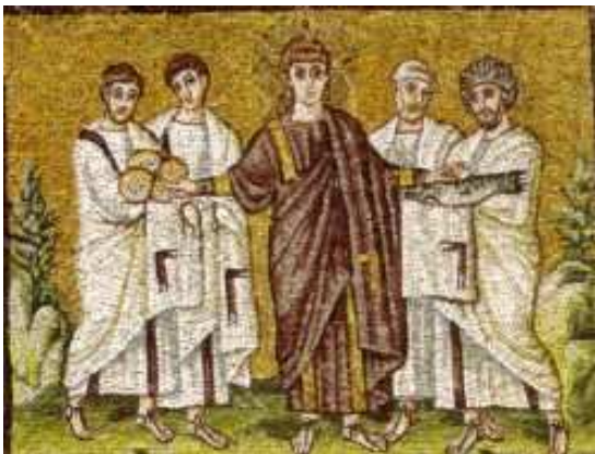
Ravenna, S. Apollinare Nuovo, Moltiplicazione dei pani e dei pesci

«L'unione fa la forza», suona un antico adagio. Anche la fisica insegna che quando due vettori di una forza muovono nella stessa direzione, la risultante è la somma dei due vettori iniziali. Le tecnologie informatiche oggi ci insegnano che "condividere conviene": lo sharing (appunto la "condivisione") è uno dei concetti chiave del cosiddetto web 2.0, ossia la partecipazione di tutti alla costruzione delle risorse internet. Insomma, dovrebbe esser chiaro che mettere in comune i propri beni consente a ciascuno di trarre un grande beneficio dal lavoro di tutti.