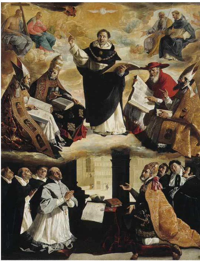
Francisco de Zurbarán, Apoteosi di S. Tommaso d'Aquino, 1631, Museo Bellas Artes, Siviglia

L'originalità della posizione tomista, dunque, non consiste in una negazione della partecipazione a favore della causalità, ma deve essere cercata nella novità dei principi, grazie ai quali è riuscito a salvare l'una, proprio dando all'altra tutta l'espansione che le conveniva.